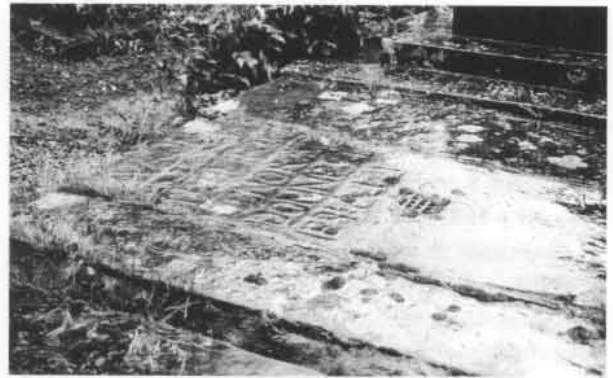
Fig. 56. Plate-tombe avec une ouverture fermée par une grille en fer forgé. L'ouverture persiste sur la pierre du haut; elle est bouchée par du ciment sur celle du bas et nettement excentrée (réemploi?). Les relevés graphiques de ces pierres sont donnés. Bustince (BN).