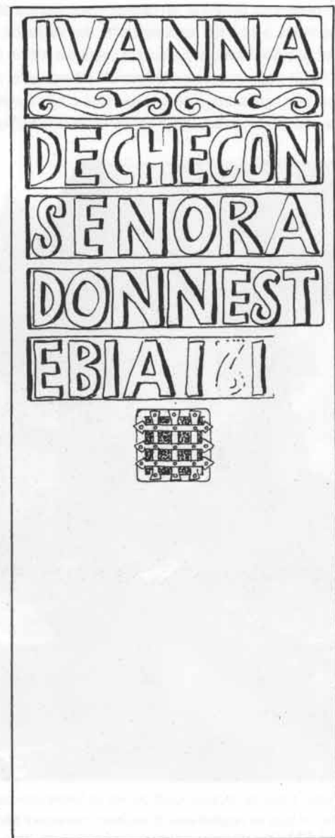
Fig. 57. Dessin de la même plate-tombe cité auparavant. Bustince (BN).