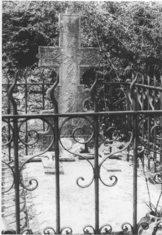
Fig. 54. On garde le monument dressé traditionnel (la croix), mais l'iconographie est renouvelée. Bustince (BN).