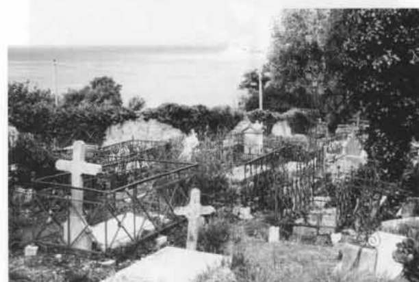
Fig. 53. Vieux cimetière de Ciboure (L).

Autre forme de caveau moderne qui a commencé à se diffuser à partir des dernières années du siècle précédent (voir par exemple photographie du vieux cimetière de Ciboure): (Fig. 53 a 60)