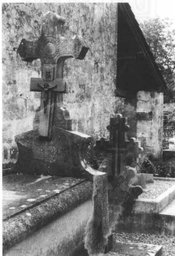
Fig. 51. Deux types de caveaux, celui qui est en arrière plan est plus "modeste", et plus en rapport avec la tradition: monument traditionnel (croix); faible sur-élévation au dessus du niveau du sol; surface couverte de graviers.

Le cimetière de Bustince, en Garazi, nous montre de très bons exemples, tout à fait représentatifs, de l'évolution locale de l'art funéraire basque jusqu'à la première moitié de ce siècle. Depuis peu, un caveau "industriel" est implanté, chassant deux très belles croix, posées (comme c'est l'habitude), contre le mur du cimetière, pour l'oubli ou la destruction.