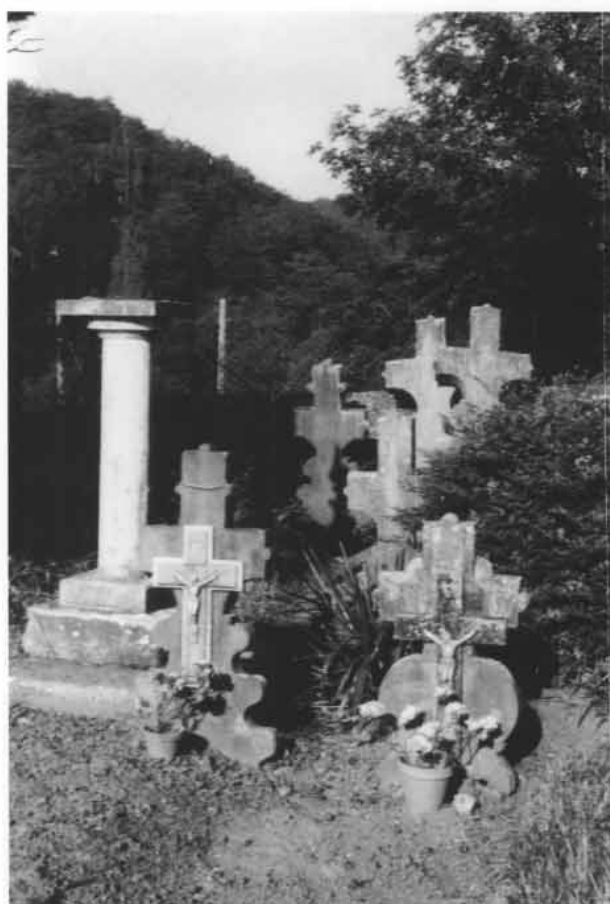
Fig. 52. Le cimetière traditionnel et la croix du cimetière.

Autre forme de caveau moderne qui a commencé à se diffuser à partir des dernières années du siècle précédent (voir par exemple photographie du vieux cimetière de Ciboure): (Fig. 53 a 60)