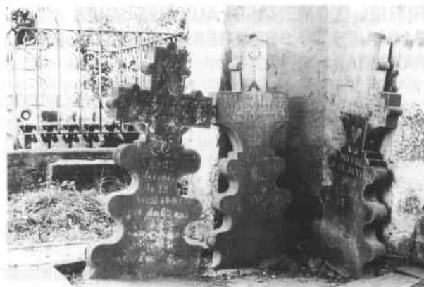
Fig. 59. La croix du haut, située au centre, montre un ostensorio peint avec deux couleurs différentes. La polychromie des monuments a été signalée par Veyrin et Colas, mais elle n'a jamais été étudiée à ce jour (à part le travail présenté par M.D. au congrès de Carcassonne, en 1987). C'est donc la première fois que nous avons des données: a) Sur les façons de peindre; b) sur les couleurs utilisées dans le passé récent. Bustince (BN).