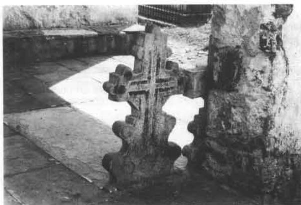
Fig. 58. Sur le porche subsistent de nombreux monuments ayant conservé des parties peintes. Cette peinture s'écaille par endroits et laisse apparaître, sous les divers repeints, des couches de couleurs anciennes: bleues, vertes, etc. Ces couleurs ont été restituées sur des relevés graphiques. Bustince (BN).