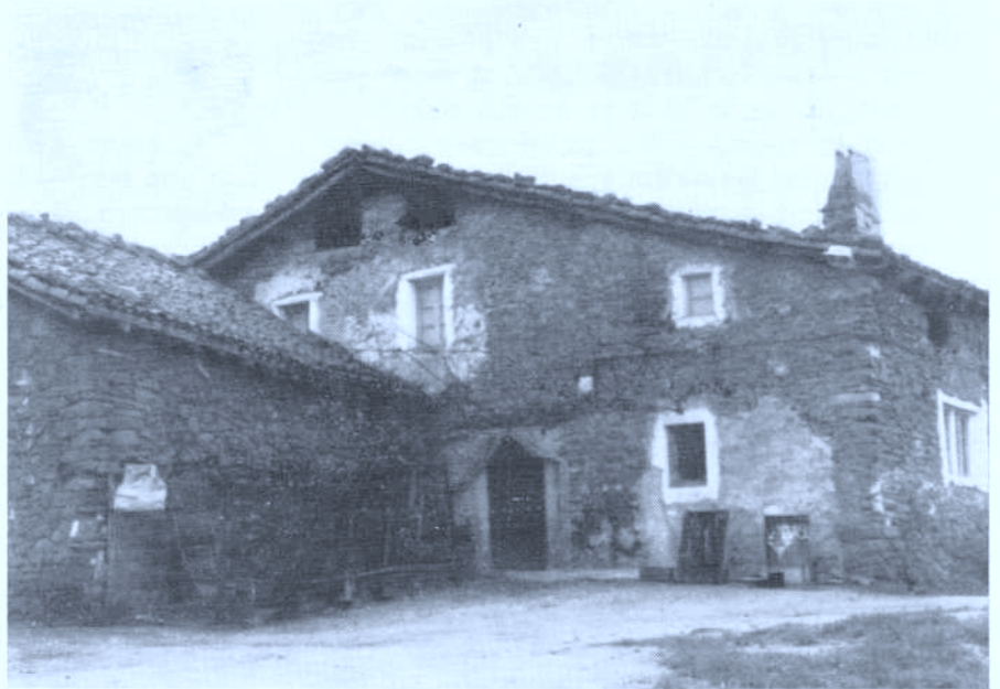
Foto 2 Caserío Urbizu erdikoa en donde en una de sus fachadas laterales se encuentra sobre un dintel de puerta empotrada la estela discoidea. Cliché: Fermin Leizaola 29.11.82

Dicha cruz está inscrita en una orla perimetral que limita el disco. En la pata inferior de la cruz de Malta tiene grabada una pequeña cruz latina que parece haber sido hecha posteriormente a la ejecución de la estela. Algo parecido ocurre con la fecha que tiene grabada en el cuello que inicia el pie de la estela (fotografías N.º 4 y 5) que también es posible que haya sido ejecutada más tarde que la primitiva estela (1).