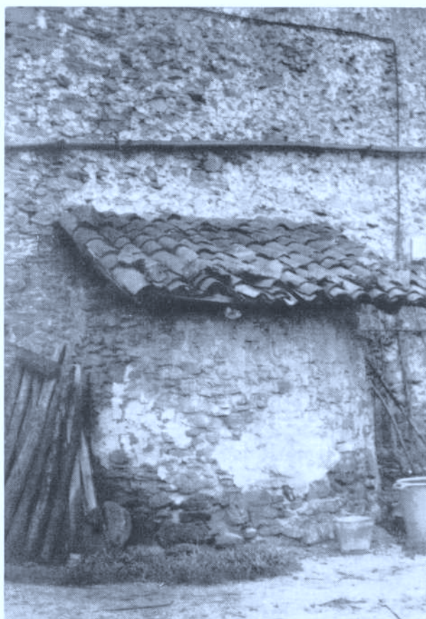
Foto 3 — Labea (horno para cocer pan) del caserío Aldasoro también conocido por Urbizu-auzkoa. 29.11.82

La presente estela tiene cierta semejanza con la estela de Errotazarrena de Segura, con la de Aizpuru de Mutiloa, así como con la de Ibarreta de Zegama y sobre todo con la existente junto al caserío Arrikruz del barrio de