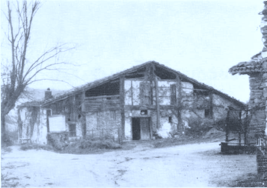
Foto 1 Caserío Bekoetxea en el barrio de Urbizu o Auzokalde (Idiazabal - Guipúzcoa) Cliché: Fermin Leizaola 29.11.82