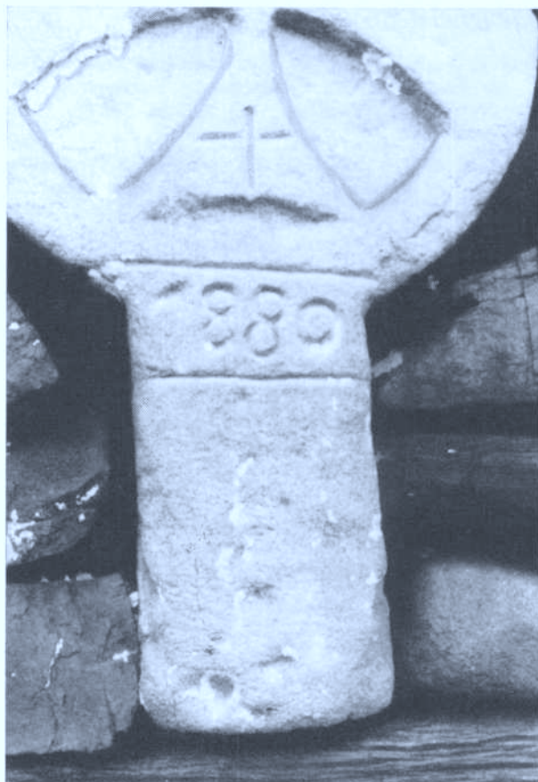
Foto 5 — Detalle del pie, fecha y cruz incisa de la estela. 29.11.82

Aránzazu en Oñate, bajo la carretera y próximo a la famosa cueva del mismo nombre. (Consúltese la bibliografía).