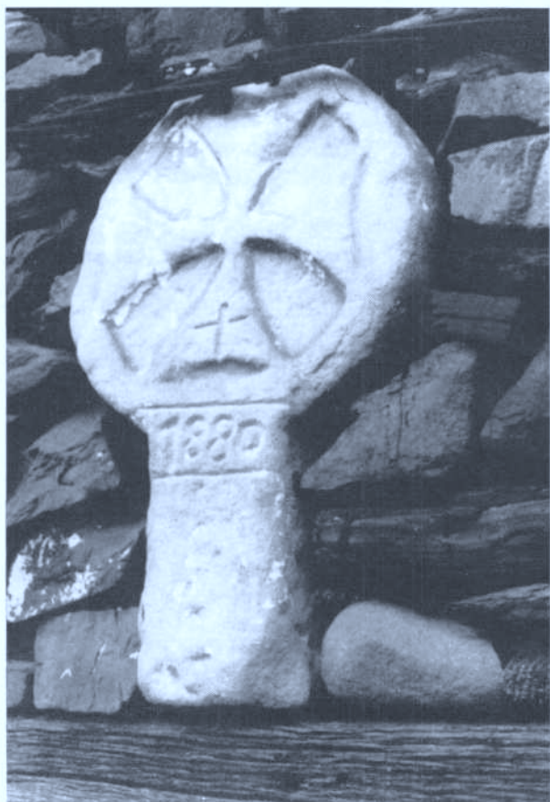
Foto 4 — Estela discoidea empotrada en la fachada, sobre una puerta, del caserío Urbizu erdikoa (Idiazabal - Guipúzcoa). Cliché: Fermín Leizaola 29.11.82